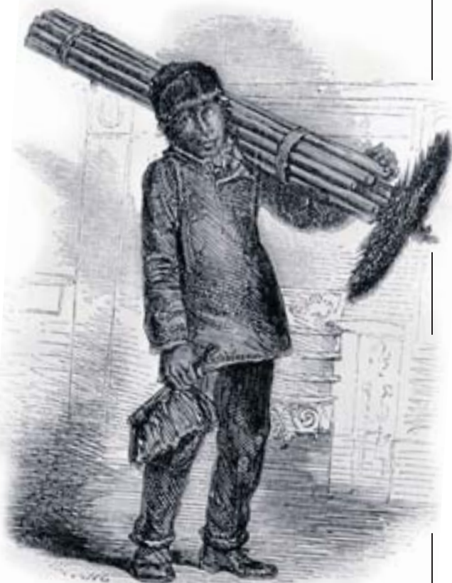
Gravat del 1849 que mostra un nen escura-xemeneies.

Un dia, el 1875, un jove de 12 anys estava netejant la xemeneia d'un hospital quan es va encallar al mig del conducte. Per fer-lo sortir van haver d'enderrocar tot el mur exterior de la xemeneia. Tot i que va sortir amb vida, l'infant va morir poc després a causa de l'aire tòxic que havia inhalat. Aquest fet es va fer tan famós que va provocar que el Parlament britànic prohibís definitivament la pràctica d'utilitzar nens per entrar dins les xemeneies i netejar-les.